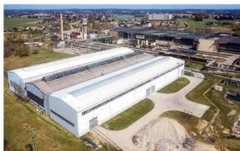
FOTO: ArcelorMittal Tubular Products Karviná sponzoruje místní fotbalový tým FK Karviná

Chcete se přijít také podívat? Tak neváhejte napsat na e-mail: amtpk.podatelna@arcelormittal.com .